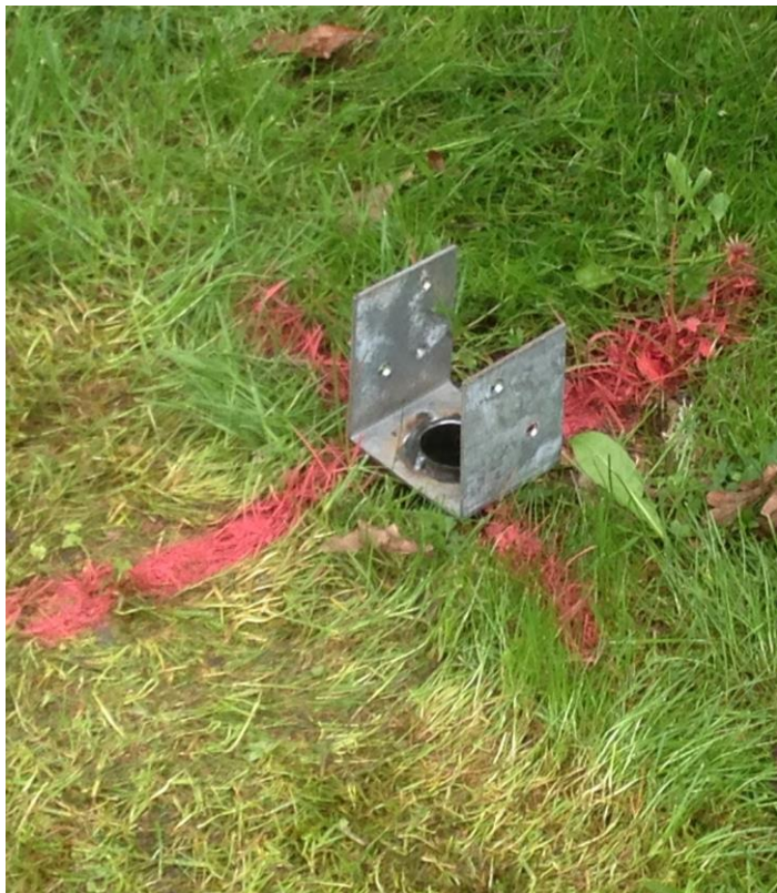
Enkelt och snabbt utfört utan åverkan på marken.

Grundtuben (Gt48) ger möjlighet till en effektiv grundläggning för lättare förankringar som direkt efter installation kan ta upp tryck-, drag- och momentlast.