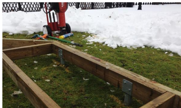
Grundläggning med minimal åverkan på kringliggande mark