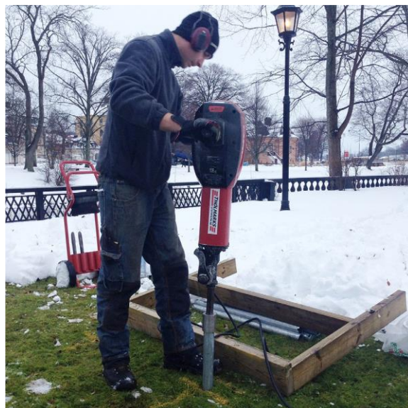
Neddrivningen i marken med hjälp av 30 kg bilmaskin.